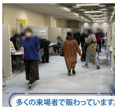
多くの来場者で賑わっています。