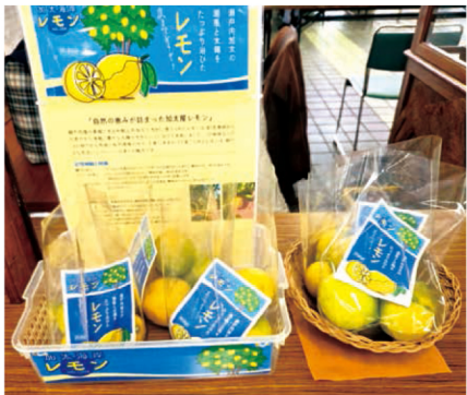
今回初めて加太農園管理業務として栽培しているレモンを販売しました。

今回は午前中の出店準備時からお客さんが来て下さり、和歌山のポストカードを手に取り購入して下さった方が多くいます。近頃はSNSで連絡を気軽に取り合えることや、郵便代の値上げ等もあり、ハガキを出すことも減りましたが、イラストを見てとても素敵なので「飾っておくのもいいですね」と言う嬉しい意見もいただきました。また、『雑賀崎のポストカードが欲しいな』と云って下さったお客さんもあり、先日市民図書館で展示していたイラストですね。アート展観ましたと言ってお下さったり、自分が描いたポストカードを買って下さった方もいて、嬉しくて少し照れかかったです。