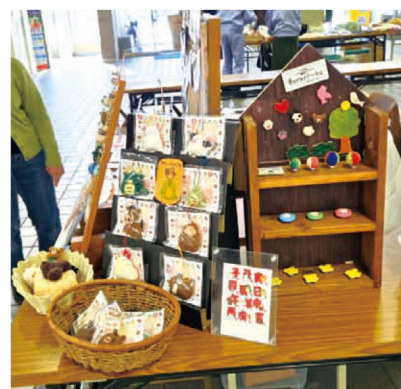
いつも大好評な編みぐるみやそのた手作り商品。

新作の『東ラクリ丁』を見て、「懐かしいなあ」と昔を思い出して購入して下さった方等。こうして自分たちが描いてきた様々な和歌山の風景イラストを見ながら、昔に想いを馳せていただいたり、和歌山のお土産に買って行っていただいたり、自分ではもうこの場所に行くことが出来ないからと、イラストを飾って、行った気分になりますね。など、描いたイラストを見ていただいたり、渡った時の感想が何よりの宝物です。街の風景も時代とともに変化していき、古い建物がなくなったり、新しい建物が生まれたり、まだまだ和歌山には素敵な名所がたくさんあります。これからも和歌山の魅力を伝えられるよういろいろなイラストを制作していきたいと思っています。